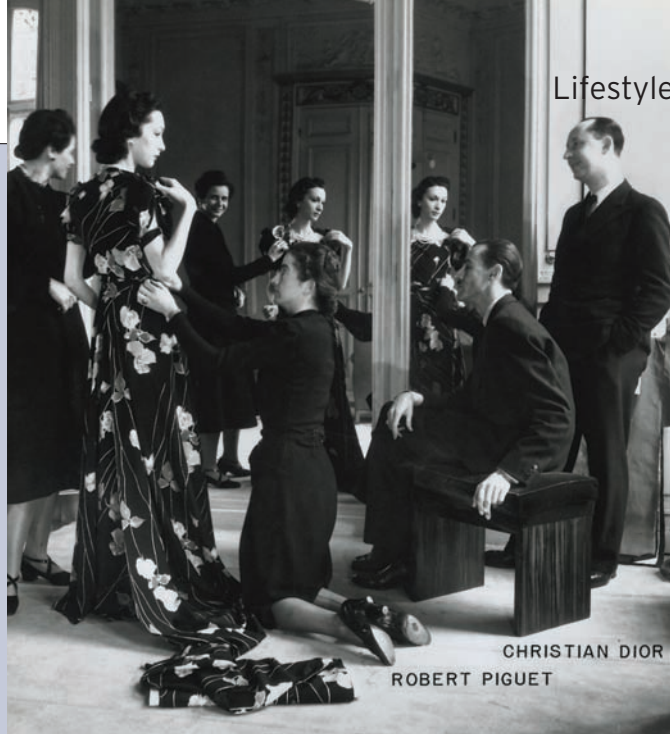
CHRISTIAN DIOR ROBERT PIGUET

Les Champs Elysées in den 1940er Jahren, „tout Paris“ liegt ihm zu Füßen: Modeschöpfer Robert Piguet , bei dem legendäre Couturiers wie Hubert de Givenchy oder Christian Dior die hohe Kunst der Schneiderei „sur mesure“ erlernten. Ungewöhnlich wie seine Mode waren auch seine Duftkreationen, welche noch heute bei Bergdorf Goodman in New York reißenden Absatz finden und endlich auch in Deutschland erhältlich sind. Bandit ist einer davon – ein kraftvolles, ledrig-holziges Parfum für den eleganten Mann oder die extravagante, starke Frau.