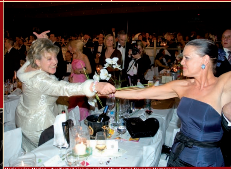
Marie Luise Marjan „duellierte“ sich zu später Stunde mit Barbara Herzsprung