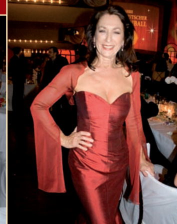
Schauspielerin Daniela Ziegler