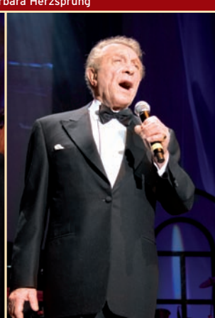
Al Martino sang seine Hits „Volare“ und „Spanish Eyes“