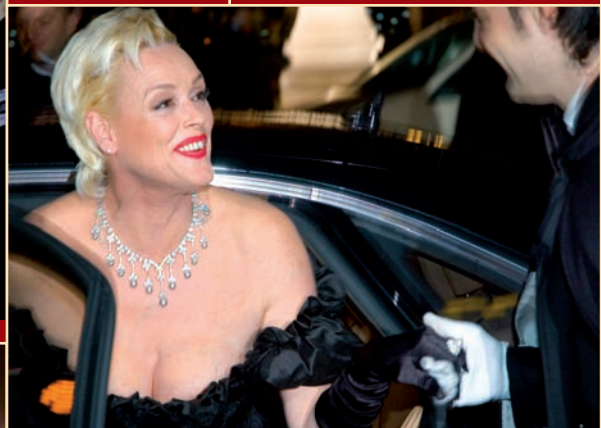
War spät dran: Brigitte Nielsen entsteigt sexy aus der Limousine