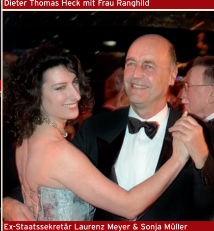
Ex-Staatssekretär Laurenz Meyer & Sonja Müller