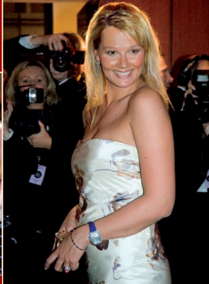
Franziska van Almsick