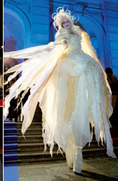
Stelzenläufer hießen die Ballgäste vor der Alten Oper willkommen