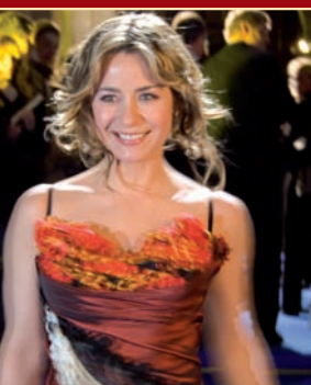
SAT 1 Moderatorin Bettina Cramer