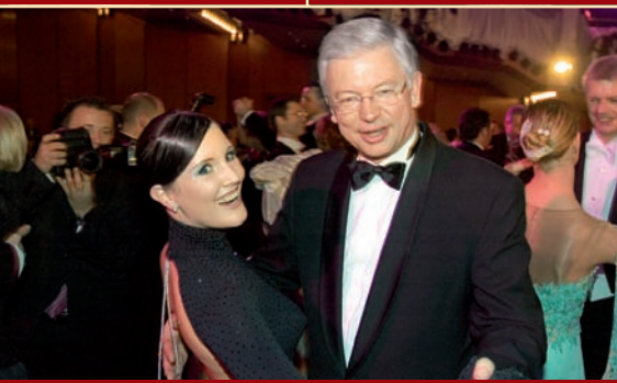
Ministerpräsident Roland Koch wurde von Tänzerin Corinna Staab zum Tanz aufgefordert