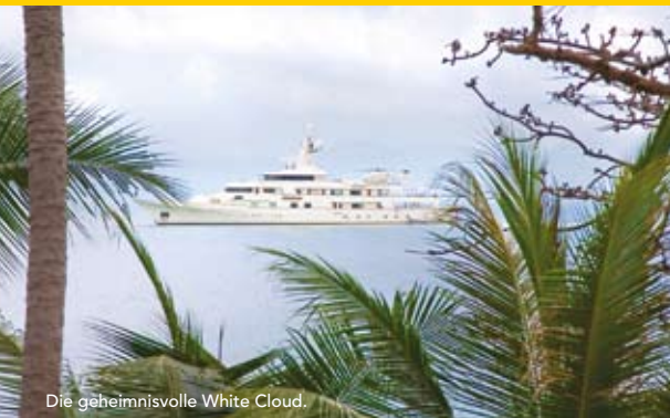
Die geheimnisvolle White Cloud.

Beobachtung erkennt, wie etwa das Sila Evason Resort & Spa, welches sich völlig abgeschieden vom Trubel der Strände befindet (s. Infos).