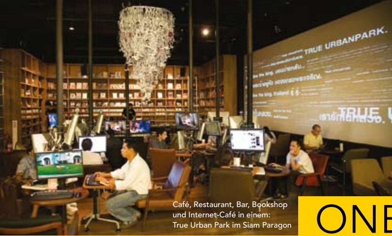
Café, Restaurant, Bar, Bookshop und Internet-Café in einem: True Urban Park im Siam Paragon