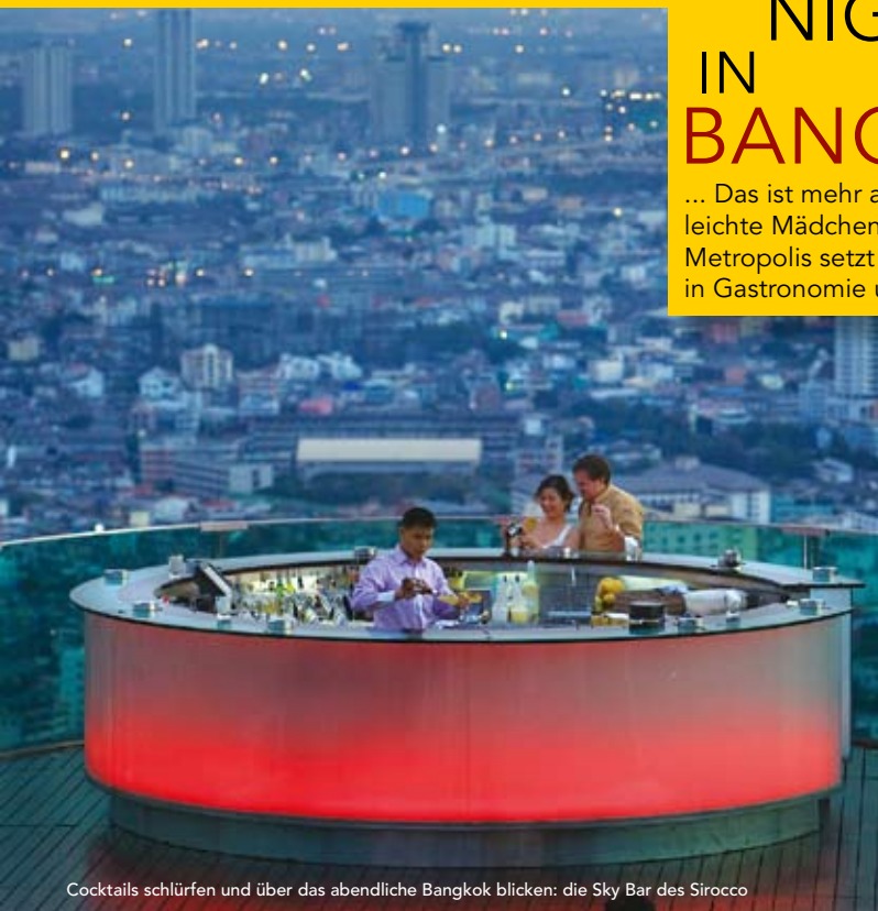
Cocktails schlürfen und über das abendliche Bangkok blicken: die Sky Bar des Sirocco

... Das ist mehr als Patpong und leichte Mädchen. Die asiatische Metropolis setzt weltweite Trends in Gastronomie und Design.