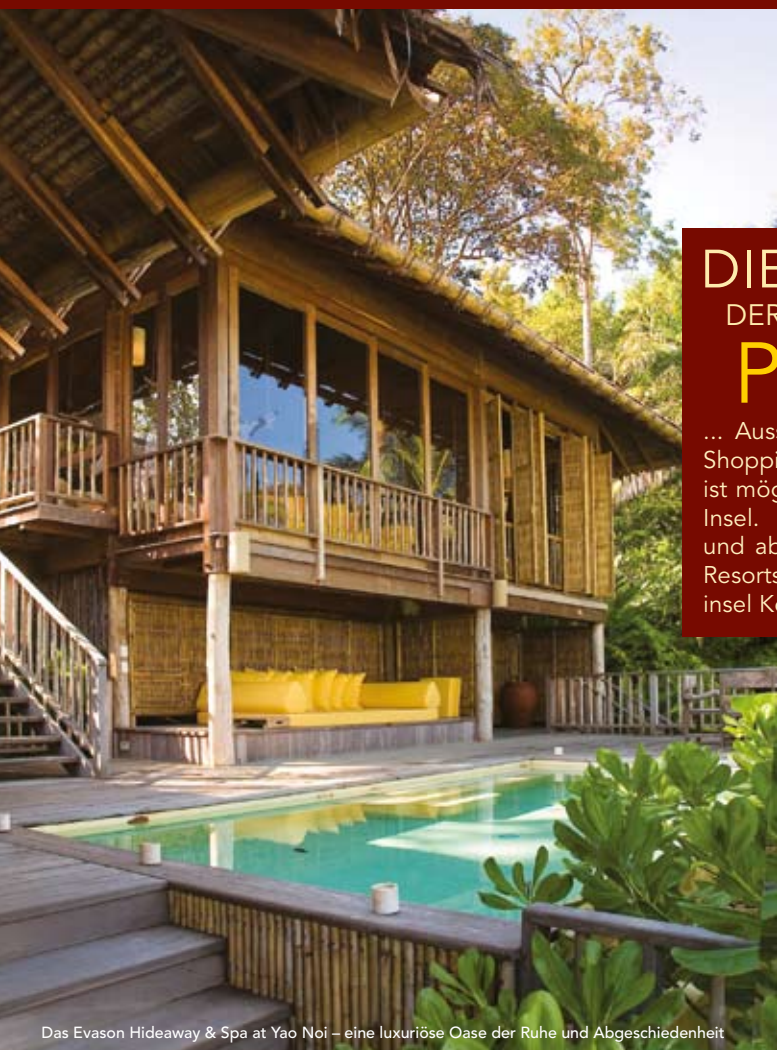
Das Evason Hideaway & Spa at Yao Noi – eine luxuriöse Oase der Ruhe und Abgeschiedenheit

... Ausschweifendes Nachtleben, Shopping und Wassersport, alles ist möglich auf Thailands größter Insel. Aber auch Entspannung und absolute Ruhe in exklusiven Resorts oder auf der Nachbarinsel Koh Yao Noi.