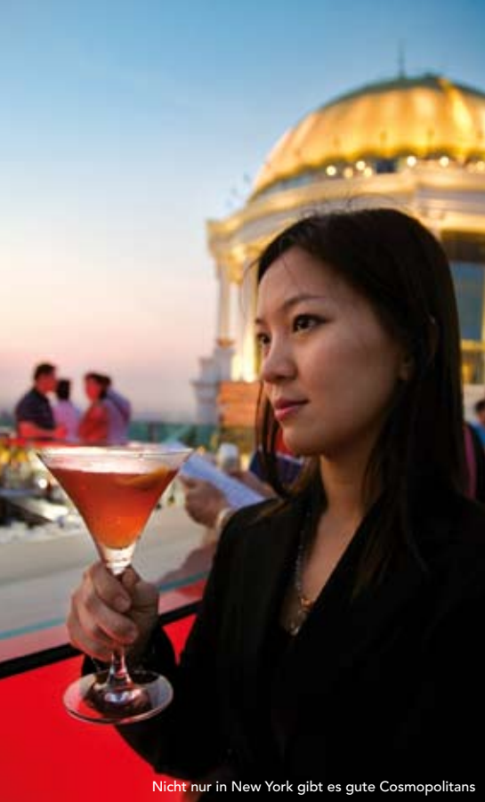
Nicht nur in New York gibt es gute Cosmopolitans

Thailand ist eben ein wenig „different“, wie man dort häufig mit einem Lächeln zu hören bekommt: Selbst als letztes Jahr das Militär putschte und Premier Taksin ins Exil nach London flüchtete, war das kein Grund zur Aufregung. Man ging auf die Straße, posierte vor den Panzern und machte Erinnerungsfotos. Die Deko im Edel-Kaufhaus Zen bestand zu jener Zeit, immerhin war Weihnachten, aus einem Christbaum und einem orangefarbene Panzer aus Holz. Überhaupt scheinen die Thais keine Gelegenheit auszulassen, um etwas zu zelebrieren und alles festlich zu schmücken: Bis weit nach Weihnachten sind Bangkoks Straßen gesäumt von überdimensionalen Nikoläusen und Christbäumen und Neujahr wird gleich dreimal gefeiert: einmal natürlich unser Silvester (mit viel Geknall und Feuerwerk), das chinesische Neujahrsfest, zu dem überall rote Lampions und Drachen leuchten und dann natürlich das Neujahrsfest der Thais, welches zwischen dem 13. und 15. April stattfindet. Das Wort Songkran stammt übrigens aus dem Sanskrit und bezeichnet den Übergang der Sonne von einem Tierkreiszeichen zum nächsten. Da die Thais mit der Zeit gehen und den Spaß selbst zu religiösen Anlässen nicht hinten anstellen, hat sich die Tradition der rituellen Waschungen zu Songkran im Laufe der Zeit zu einem feucht-fröhlichen Spektakel gewandelt: Man spritzt sich mit Wasser naß. Vorsicht! Dieser Brauch artet in regelrechte Wasserschlachten aus, bei denen keiner trocken bleibt – auch Touristen nicht.