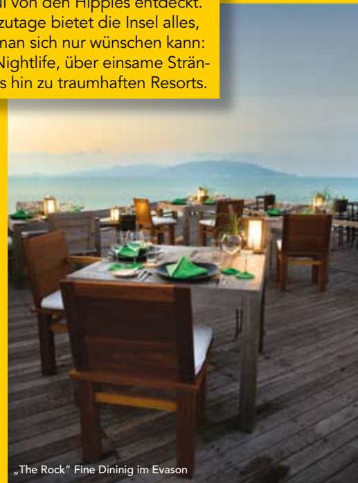
„The Rock“ Fine Dininig im Evason