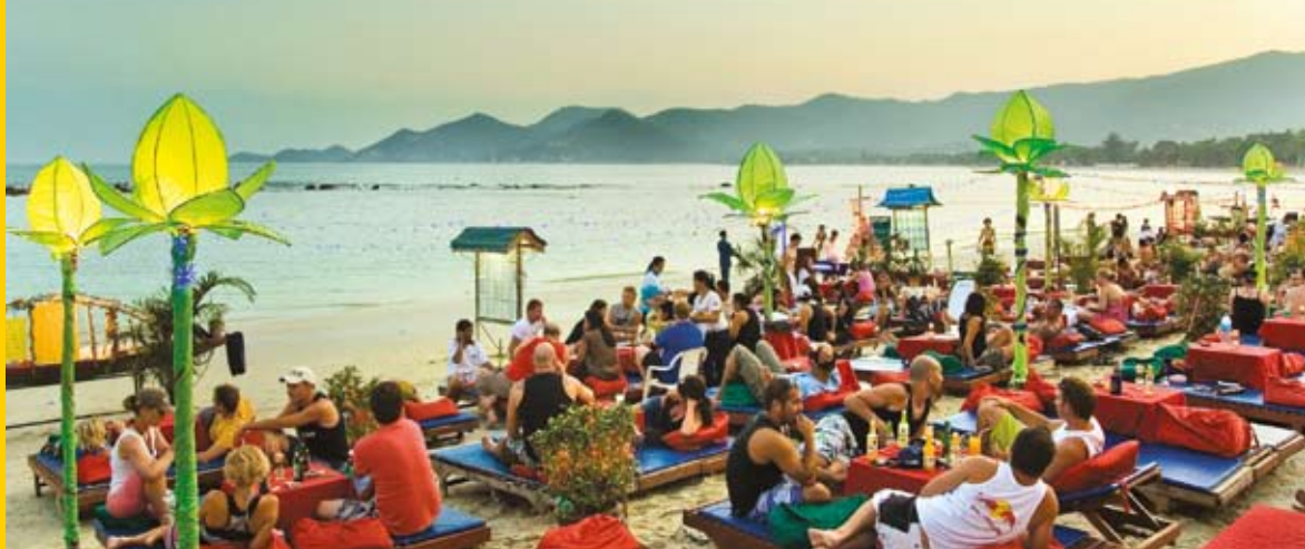
Die Ark Bar am Chaweng Beach - der ideale Treffpunkt für einen Sundowner direkt am Strand.