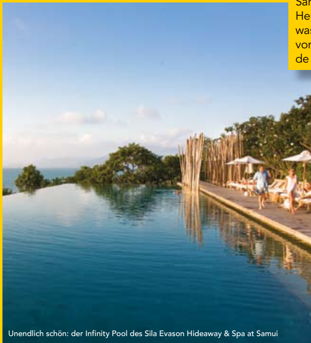
Unendlich schön: der Infinity Pool des Sila Evason Hideaway & Spa at Samui