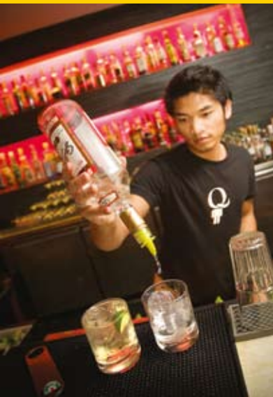
Angesagt und mit herrlichem Blick aufgrund der Hanglage: die Q Bar in Chaweng.

... Wie Bali, Goa und Ibiza wurde Samui von den Hippies entdeckt. Heutzutage bietet die Insel alles, was man sich nur wünschen kann: von Nightlife, über einsame Strände bis hin zu traumhaften Resorts.