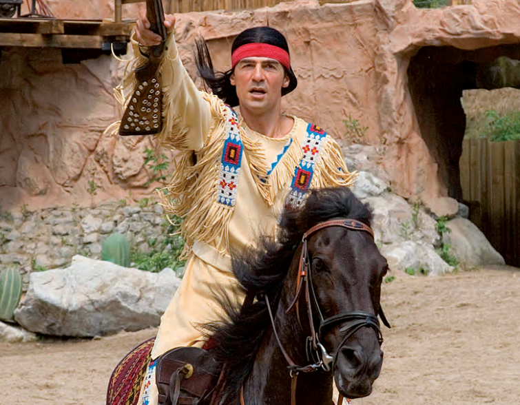
Erol Sander als Winnetou in Bad Segeberg

„ICH WILL UNTERHALTEN – DIE MENSCHEN ZUM LACHEN UND ZUM WEINEN BRINGEN. ICH HABE KEINE ANGST VOR GROSSEN GEFÜHLEN.“