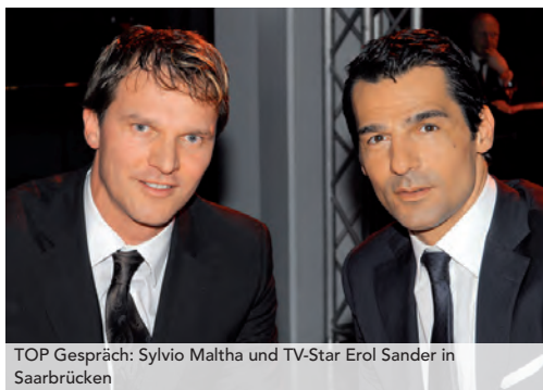
TOP Gespräch: Sylvio Maltha und TV-Star Erol Sander in Saarbrücken

Wir treffen Erol Sander auf der TOP Party in Saarbrücken. Einem Termin, auf den sich der Star seit langem ganz besonders freut. Mit dabei: seine Ehefrau Caroline, eine Französin. Für das Glamour-Event im Saarland ist das Promi-Paar extra aus München eingeflogen. Erol Sanders Auftritt auf dem Roten Teppich – wie immer ganz Profi! Charmant und elegant.