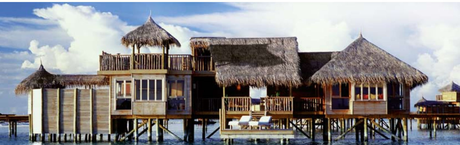
Soneva Gili Villa Suite