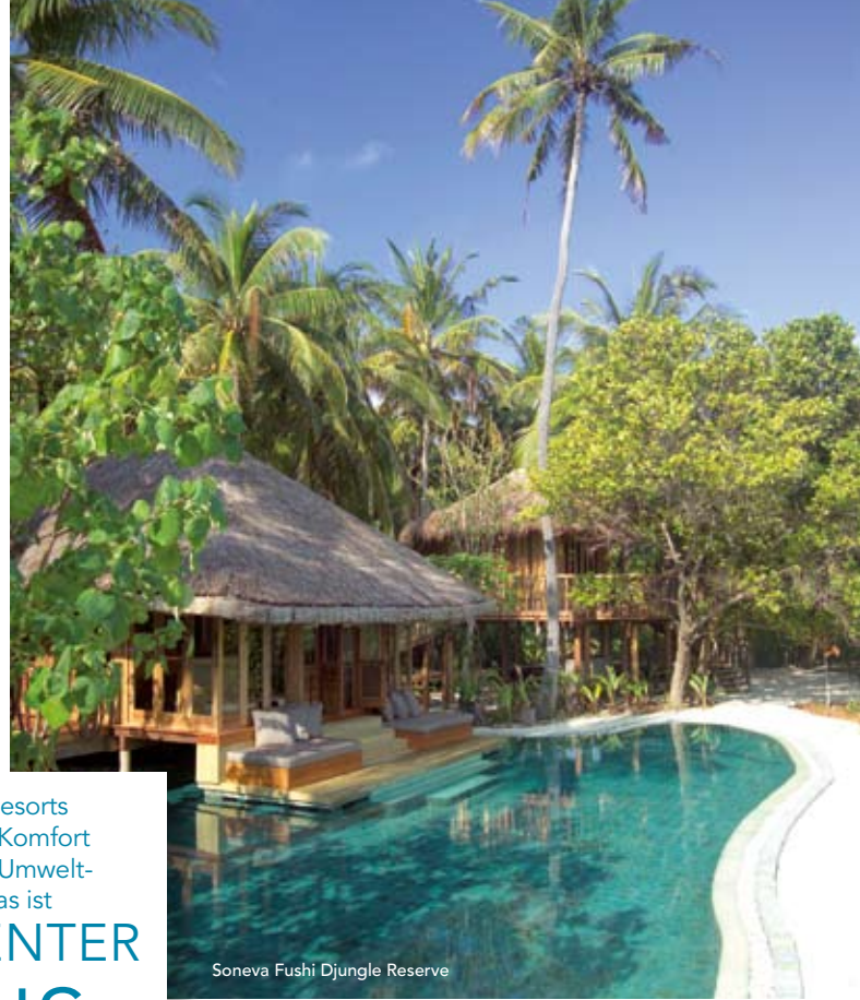
Soneva Fushi Djungle Reserve

In den Soneva-Resorts treffen First-Class-Komfort auf konsequentes Umwelt- bewußtsein. Das ist INTELLIGENTER LUXUS