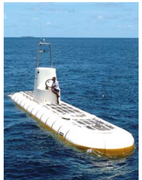
Von Muzamil Yehiya (Villa Hotels) vor sechs Jahren in Deutschland erstanden und einzigartig auf den Malediven: das weltgrößte Passagier-U-Boot Whale Submarine

stehen immerhin zu 99 Prozent aus Wasser, und wenn man sie wirklich entdecken will, gehört vor allem die einzigartige Unterwasserwelt dazu. Hier empfiehlt sich eine Tour mit dem Whale Submarine, einem U-Boot, das in Deutschland gebaut wurde. In diesem weltweit größten Passagier-U-Boot können bis zu 50 Reisende bequem im klimatisierten Innenraum Platz nehmen und eine spannende Reise in die Tiefen des Indischen Ozeans machen, ohne dabei naß zu werden. Beim ersten Stop in 25 Metern Tiefe wird man begrüßt von bunten Fischeschwärmen, die völlig unbeeindruckt um die filigranen Korallen tänzeln. Blau- und gelbschillernde Schnapperfische bahnen sich gemächlich ihren Weg, werden gekreuzt von der