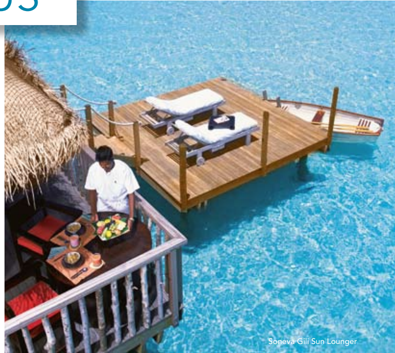
Soneva Gili Sun Lounger