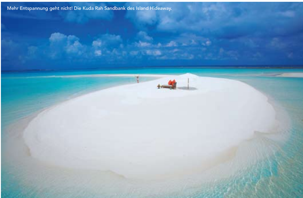
Mehr Entspannung geht nicht! Die Kuda Rah Sandbank des Island Hideaway.