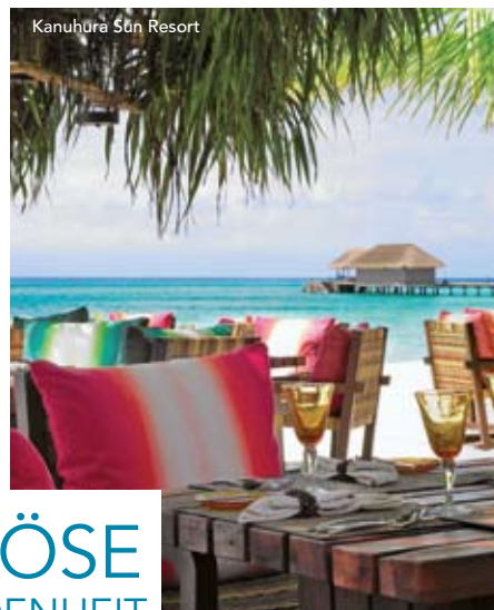
Kanuhura Sun Resort