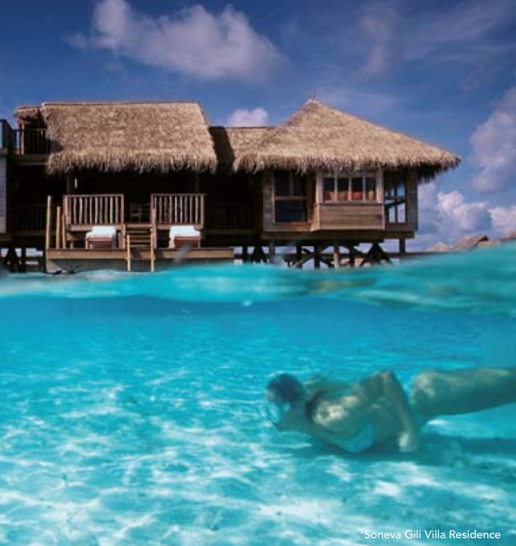
Soneva Gili Villa Residence

grottesk stacheligen Erscheinung der Rotfeuerfische und strahlend gelben Kofferschnecken sowie majestätisch dahingleitenden Schildkröten. Beim zweiten Stop in 40 Metern Tiefe ist man plötzlich in einer völlig neuen Welt – und man kann sie eigentlich im U-Boot besser erkunden als im Tauchanzug, da die Whale Submarine über eine einzigartige Außenbeleuchtung verfügt. In den dunklen Höhlen dieser Korallenwelt erkennt man die Verstecke der verschiedenen Fischpopulationen. Mit Glück bekommt man auch Weißspitzen-Riffhaie und Riesenbarsche zu sehen sowie die seltenen, vom Aussterben bedrohten Napoleonfische, die stets etwas grimmig dreinschauen. Ein solcher 45-minütiger U-Boot-Trip ist etwas, das sich kein Maledivenurlauber entgehen lassen sollte. Selbst kurz vor der Abreise kann man eine solche Tour buchen, da man in der Kabine normalen Sauerstoff atmet und nicht wie nach einem Flaschen-Tauchgang erst einmal 24 Stunde warten sollte, bevor man an Bord eines Flugzeugs steigt.