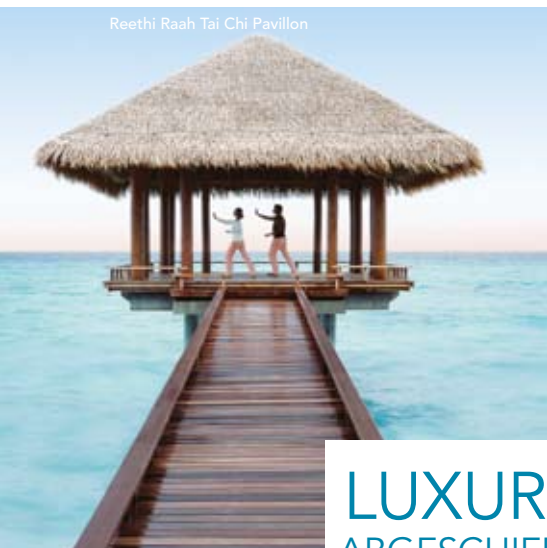
Reethi Raah Tai Chi Pavillon