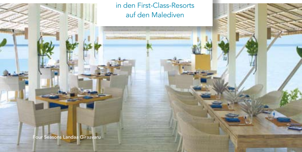
Four Seasons Landaa Giraavaru

in den First-Class-Resorts auf den Malediven