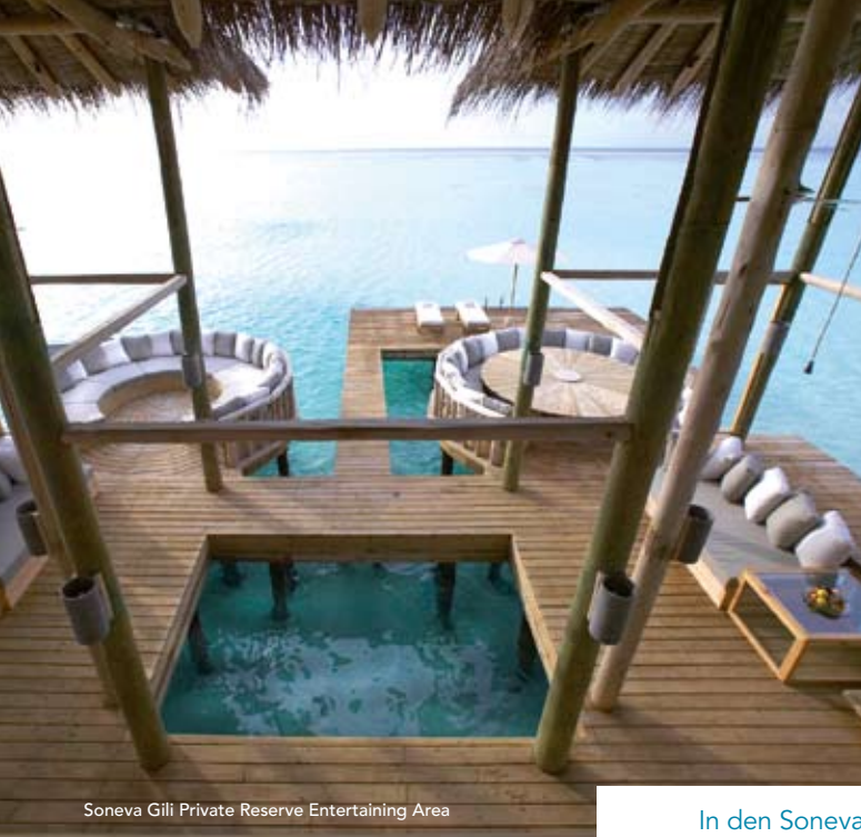
Soneva Gili Private Reserve Entertaining Area