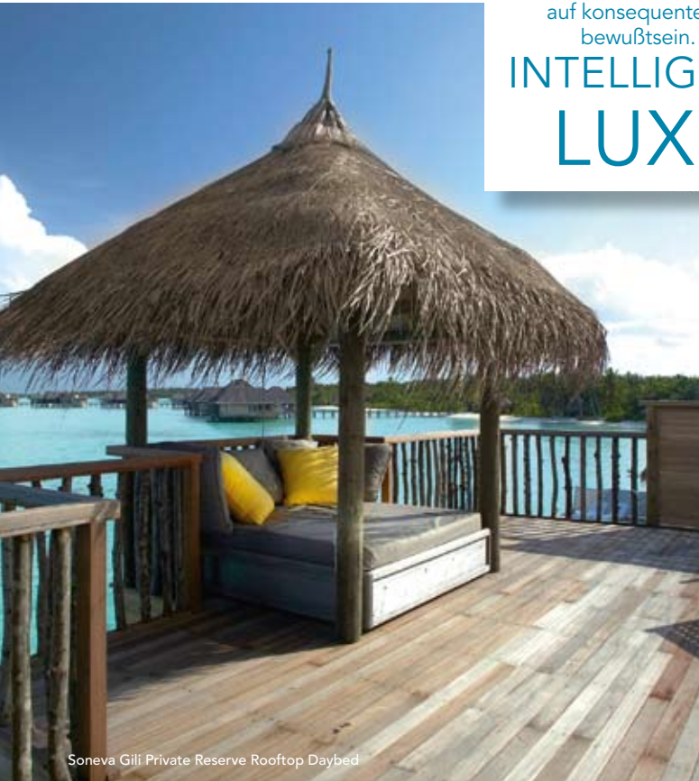
Soneva Gili Private Reserve Rooftop Daybed

In den Soneva-Resorts treffen First-Class-Komfort auf konsequentes Umwelt- bewußtsein. Das ist INTELLIGENTER LUXUS