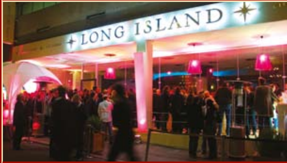
So präsentiert sich die neue Long Island Lounge von außen