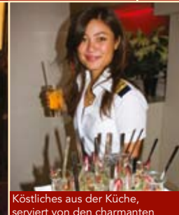
Köstliches aus der Küche, serviert von den charmanten Lounge-Hostessen