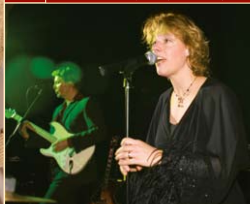
Die Frankfurter Band Relounged sorgten für musikalischen Genuß