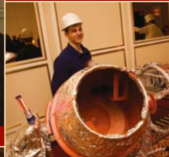
Sorgte für lange Schlangen: Frisch zubereitetes Tatar