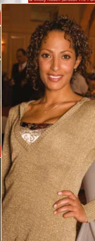
„No Angels“ Sängerin Jessica Wahls