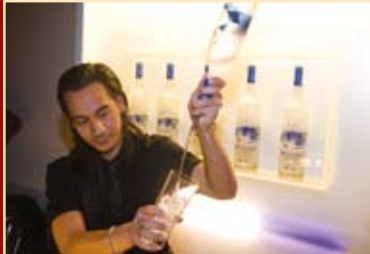
Beliebter Treffpunkt: Die Grey Goose Bar