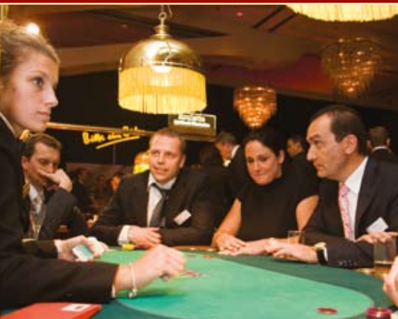
Am Spieltisch der Spielbank Wiesbaden konnten beim Pokern exklusive Preise gewonnen werden