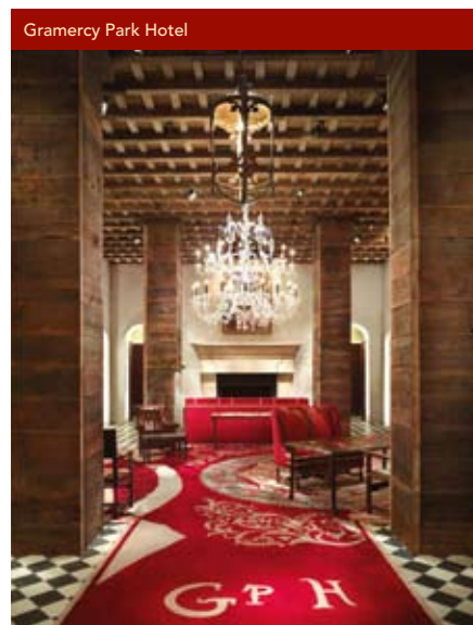
Gramercy Park Hotel

begraben scheinen, in der man die verschiedensten Sprachen hört und zudem das Spanglish, Italo-American und Asian-English der einstigen Einwanderer, in der einfach alles möglich zu sein scheint und die jeden Tag aufs Neue aufregend ist. New York ist nicht bloß Thema des bekannten Sinatra-Titels, diese Stadt ist die Definition des Satzes: „ If I can make it there, I'll make it anywhere! “ ■