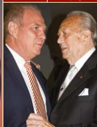
Uli Hoeneß mit Kickers-Ehrenpräsident Waldemar Klein