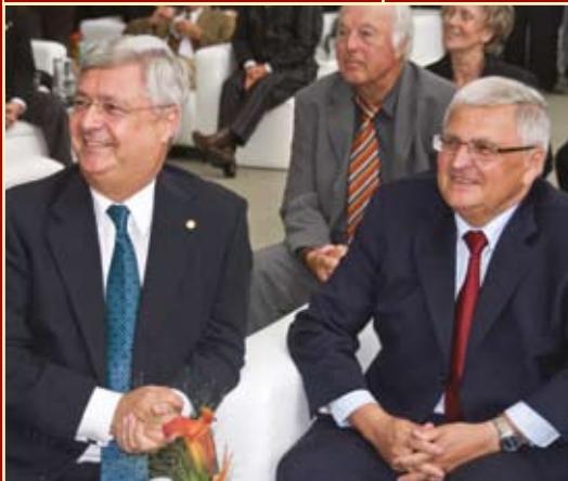
Commerzbank-Chef Klaus-Peter Müller & DFB-Boss Theo Zwanziger