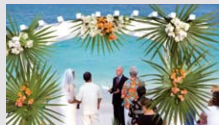
Pastellfarbene Kulisse inklusive: Hochzeit auf den Abaco Islands