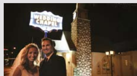
Die erste Adresse für alle, die es eilig haben: Las Vegas