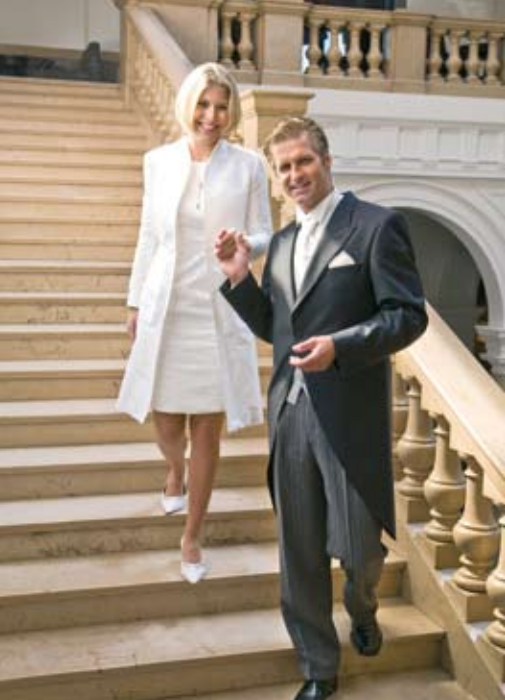
Location: King Kamehameha Suite, Outfits: Artivduum Frankfurt