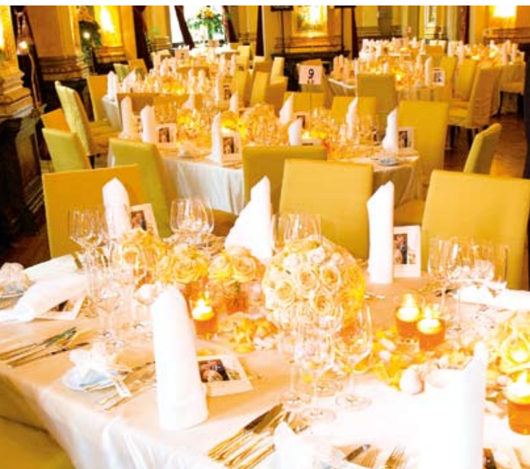
Gelb auf Weiß: ein weiteres Beispiel für die Kreativität von Erhard Priewe und seinem Team.