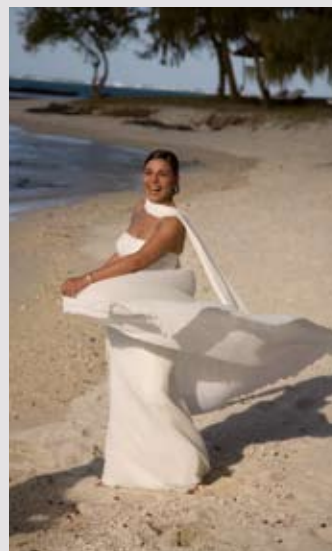
Absolut privat und traumhaft schön: Ilot Mangénie auf Mauritius