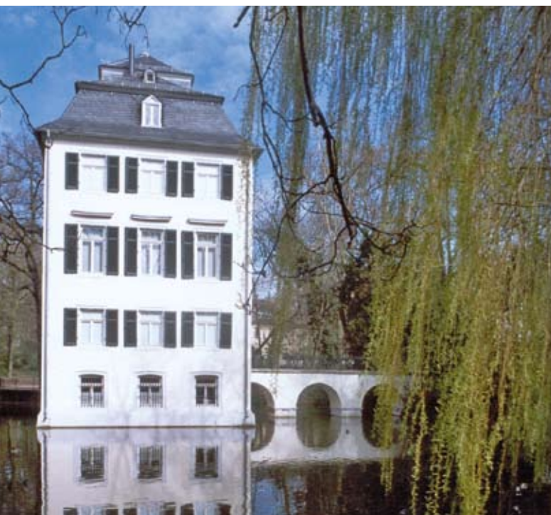
Romantik pur: das Holzhausenschlößchen in Frankfurt