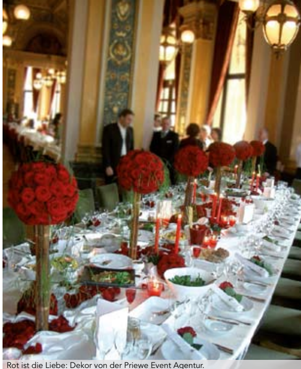
Rot ist die Liebe: Dekor von der Priewe Event Agentur.